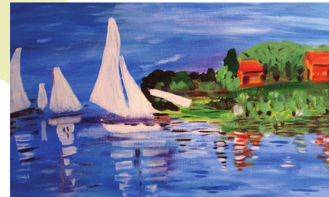
Lidija Dunato: Monet, akril na platnu