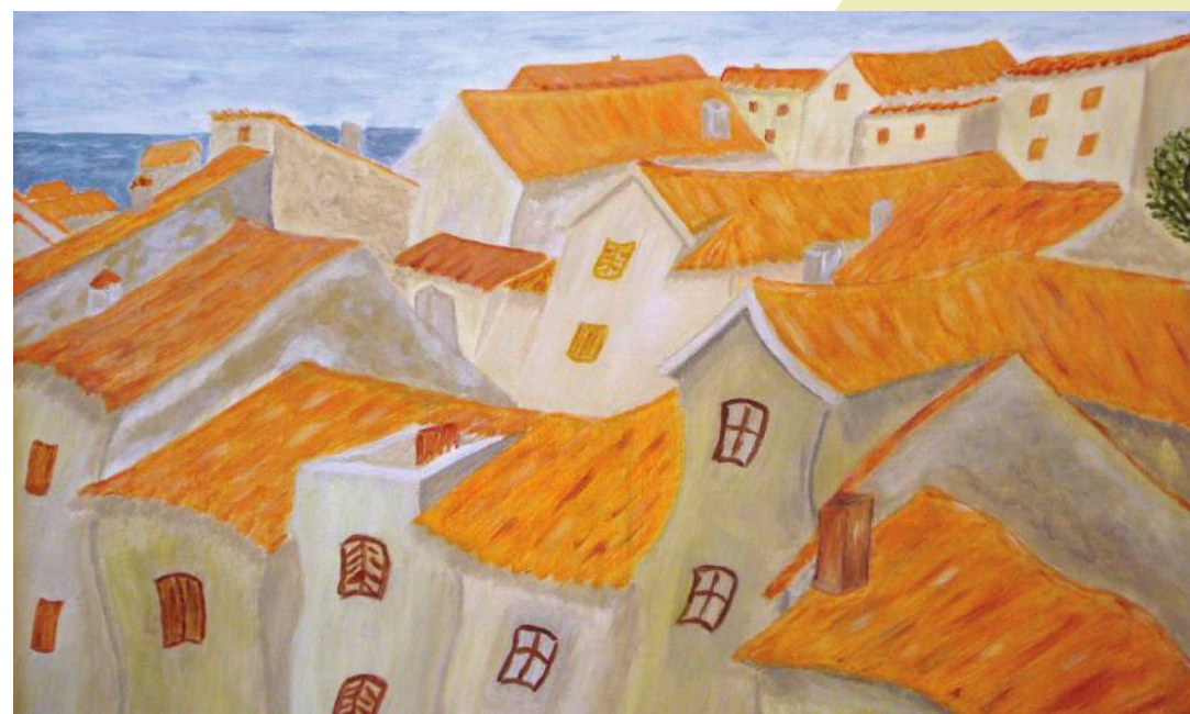
Biserka Franolić: Bašćanski krovčići, akril na platnu