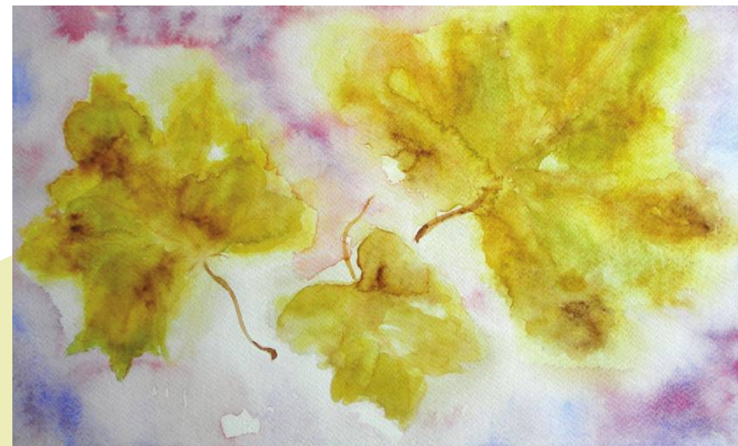
Draženka Radoš Radivojec: Lišće, akvarel na papiru