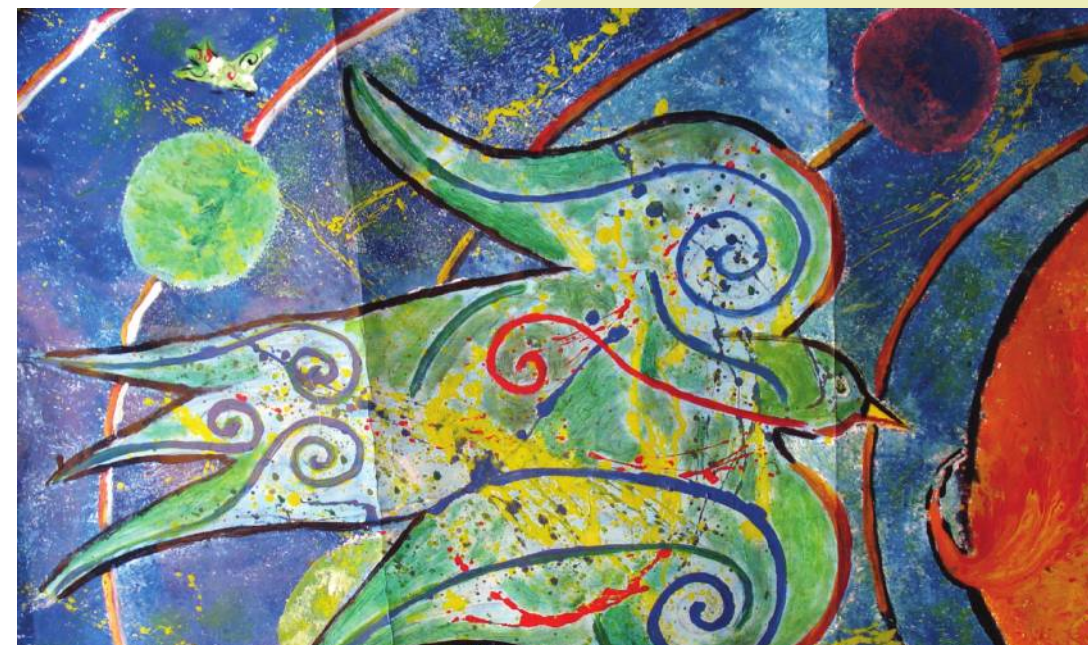
Ivan Car: Skoro sve laste izgore, boje za drvo na papiru