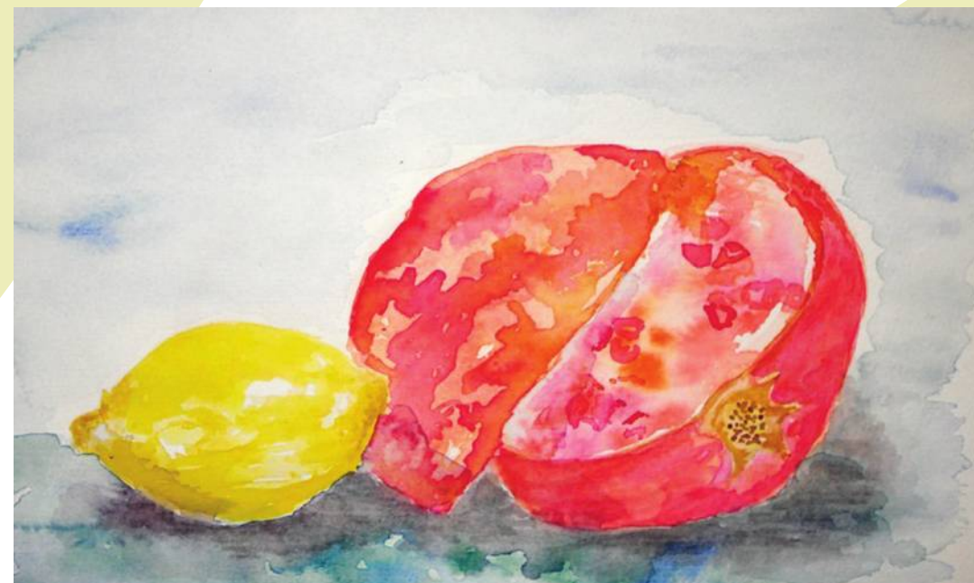
Sanja Topalušić Orlović: Nar, akvarel na papiru