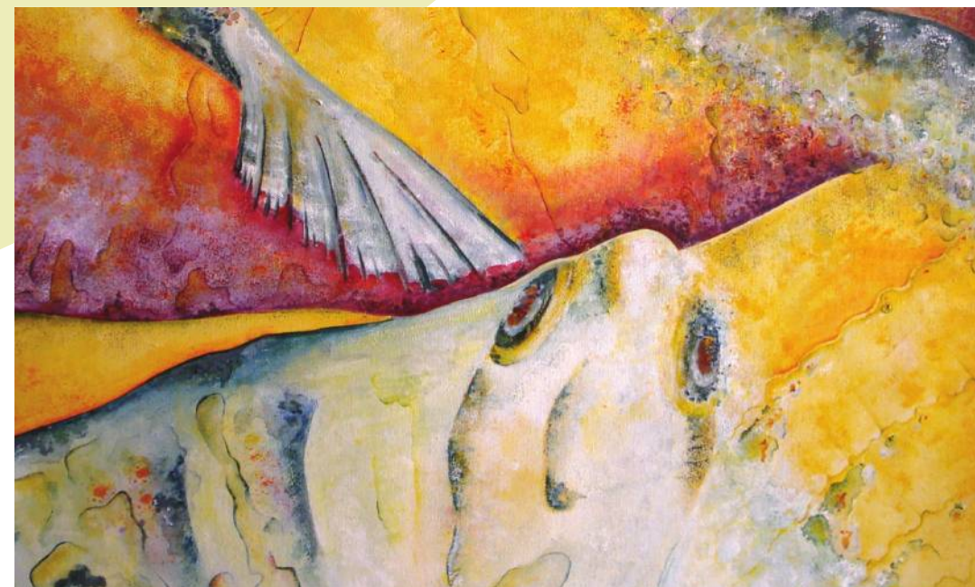
Katarina Znaor: Raža, akril na platnu